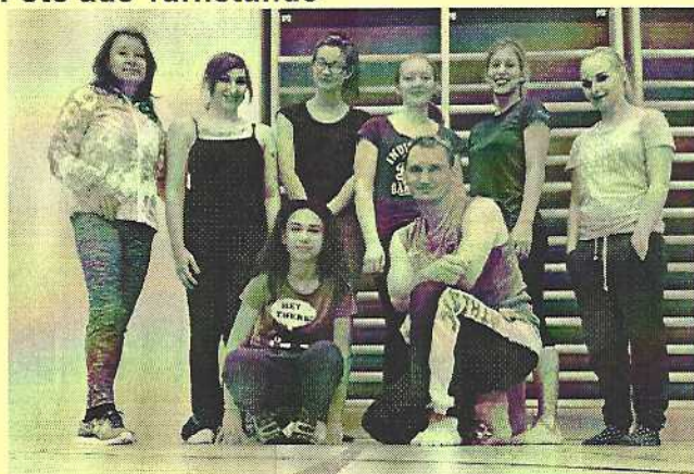
Foto aus Turnstunde