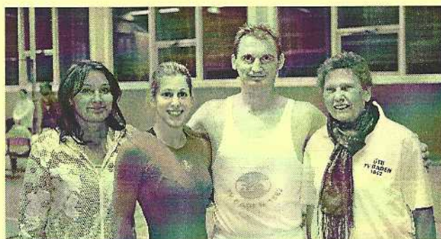
Bez.Geräte Meisterschaft 21.3.2015